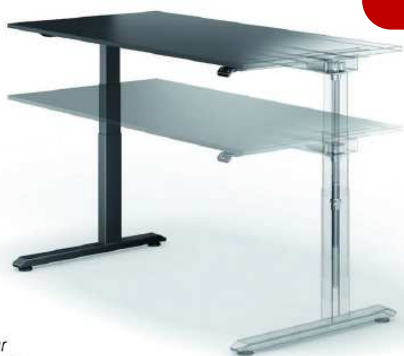
temptation c speed höhenverstellbarer Arbeitstisch (31804)

Bestellung bis 31.03.24 Auftragsbezogene Fertigung; solange die Komponenten verfügbar sind.