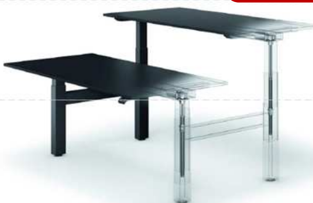
temptation smart twin höhenverstellbarer Arbeitstisch (TM10BN-2RECT)

Grundelektrifizierung des Doppelarbeitsplatzes: zentrale Kabelwanne mit Abdeckung